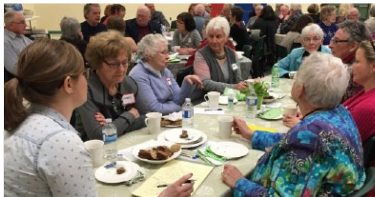
Consultations communautaires avec des personnes âgées et des aidants naturels vivant en zone rurale à Pakenham s'étant tenues lors de la manifestation Un pont entre les générations organisée par le Centre de services de soutien communautaire de Mills.

Ce modèle de prestation de services pour les collectivités rurales comprend la mise en place de trois carrefours mobiles ruraux qui seront utilisés comme bases à partir desquels le CRCOO, la collectivité et d'autres partenaires pourront offrir une multitude de services. Cette entreprise s'appuie notamment, aujourd'hui, sur des partenariats avec le Maillon santé d'Ottawa-Ouest et de la région d'Arnprior, le programme de services paramédicaux